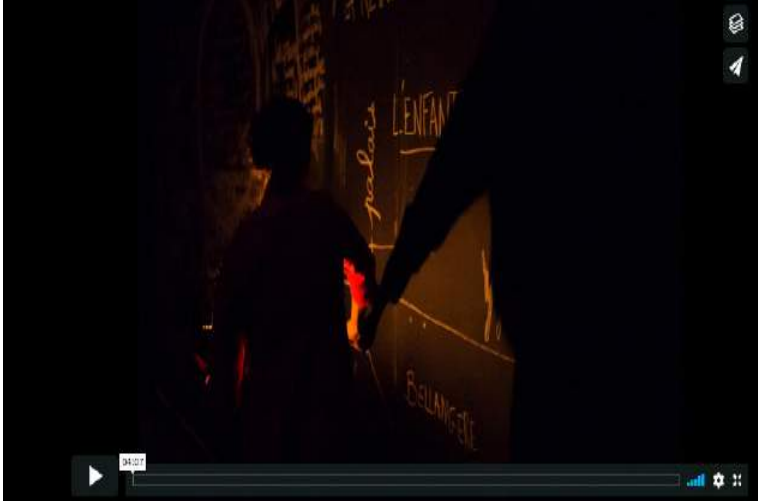
Teaser L'Enfant - https://vimeo.com/321432397