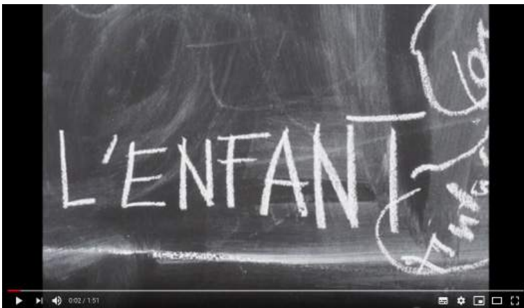
Présentation de l'Enfant par Elise Vigneron - https://www.youtube.com/watch?v=HgC5NeNmv3E