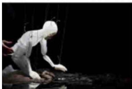
«Anywhere» d'Elise Vigneron.

Elise Vigneron a conçu une marionnette de glace qui se transforme sur scène tel Œdipe dans son errance.