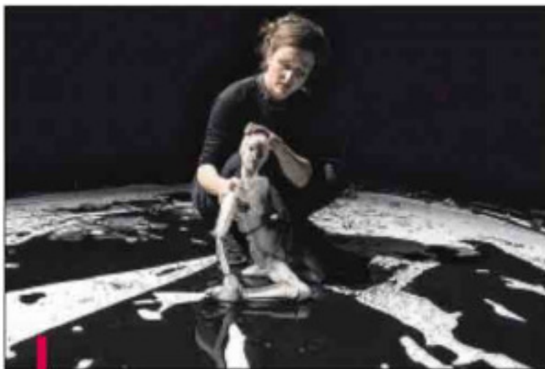
"Anywhere", l'autre lecture d'Œdipe.

Anywhere raconte l'errance autant que l'accompagnement, la perte autant que la transmission. Il y a dans le jeu du père et de la fille, ce renversement de hiérarchie en miroir qu'il existe entre la créature et son créateur. Sur scène, leur relation