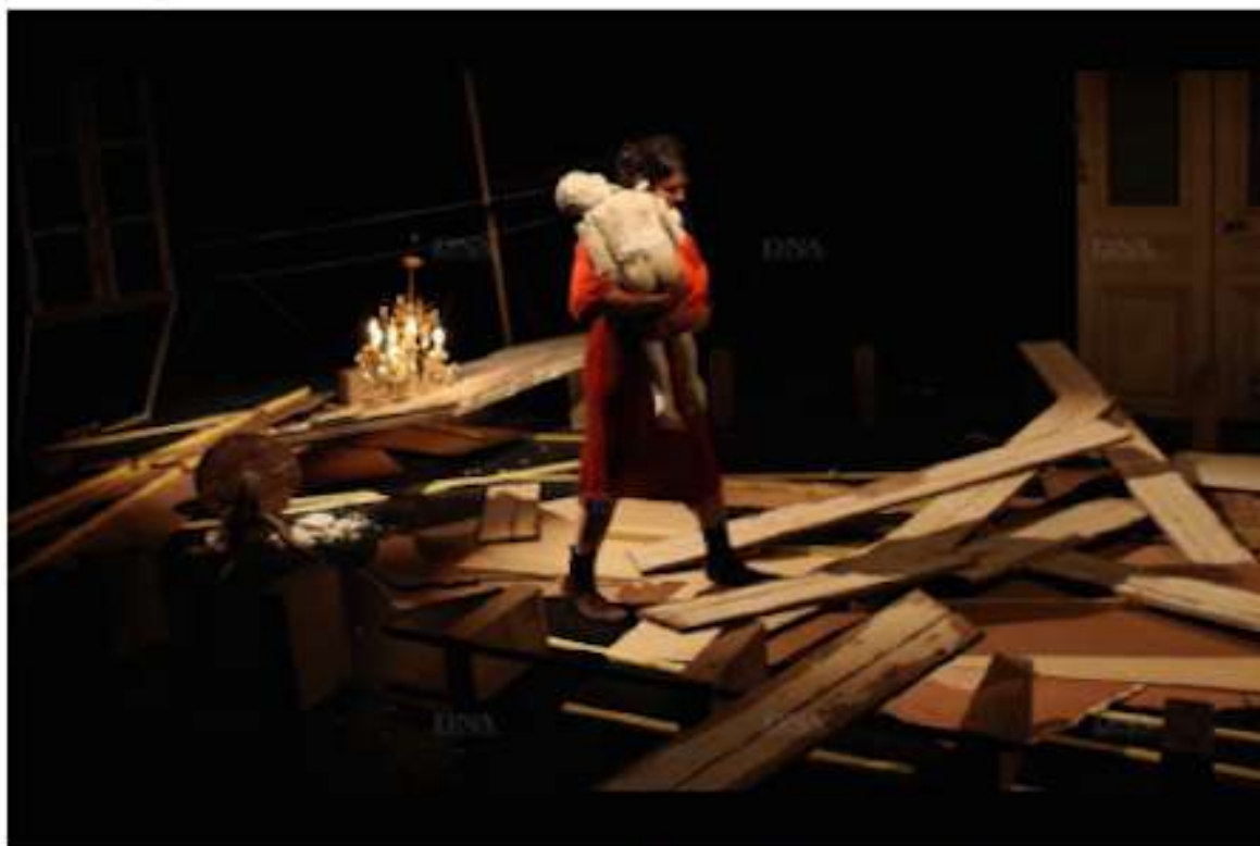
Un parcours initiatique.

Le Théâtre de l'Entrouvert porte sur le plateau du TJP/CDN à Strasbourg La mort de Tintagiles de Maeterlinck. Quelques pistes pour entrer dans l'univers imaginé de ce texte avec Elise Vigneron, metteure en scène.