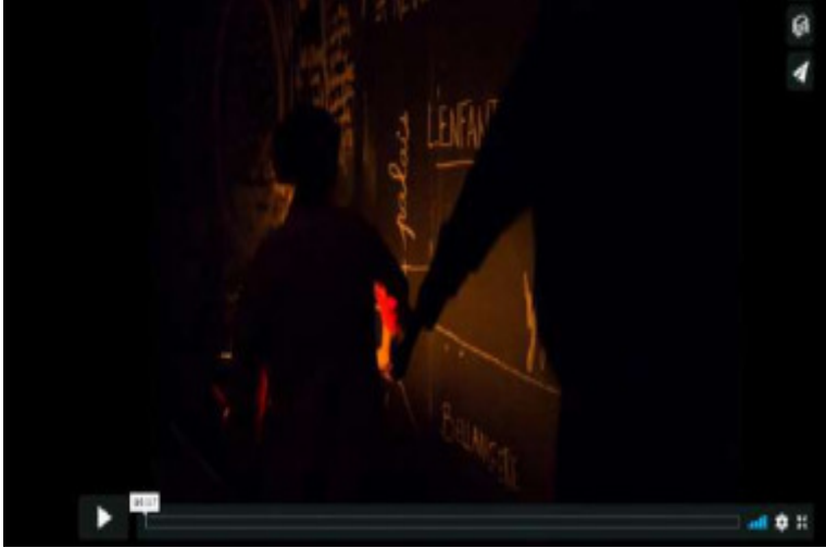
Teaser L'Enfant - https://vimeo.com/321432397