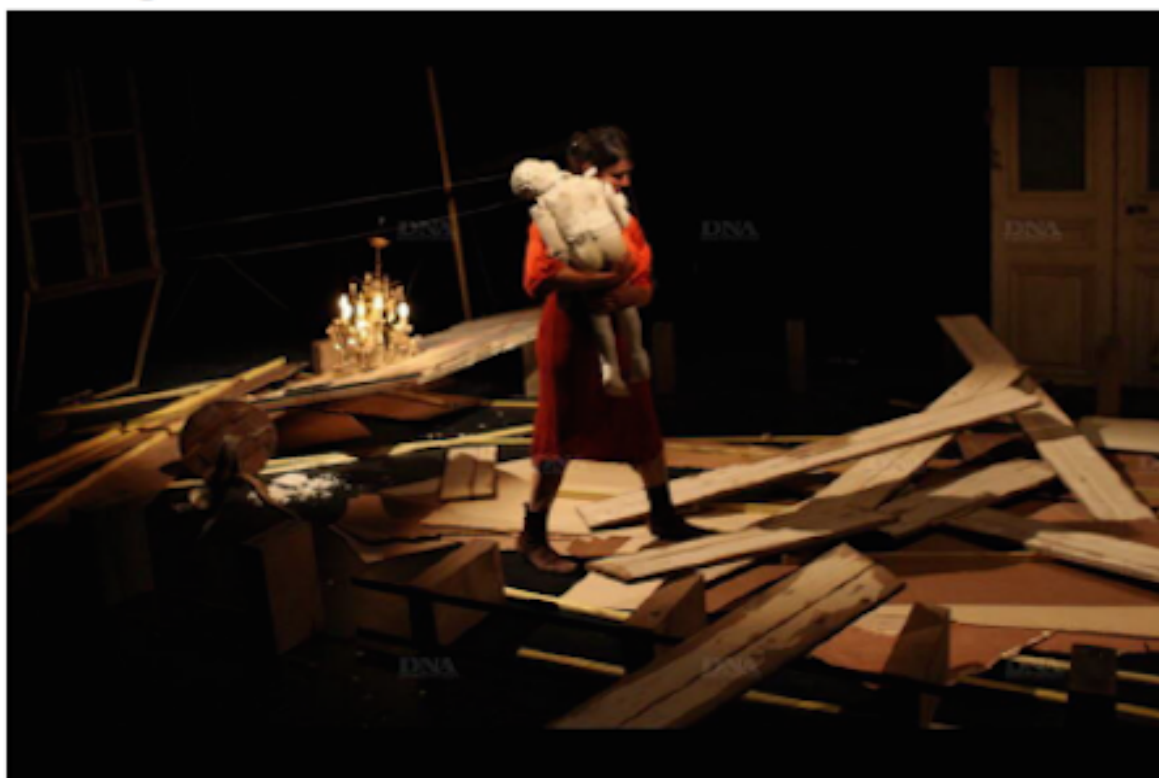
Un parcours initiatique.

Le Théâtre de l'Entrouvert porte sur le plateau du TJP/CDN à Strasbourg La mort de Tintagiles de Maeterlinck. Quelques pistes pour entrer dans l'univers imaginé de ce texte avec Elise Vigneron, metteuse en scène.