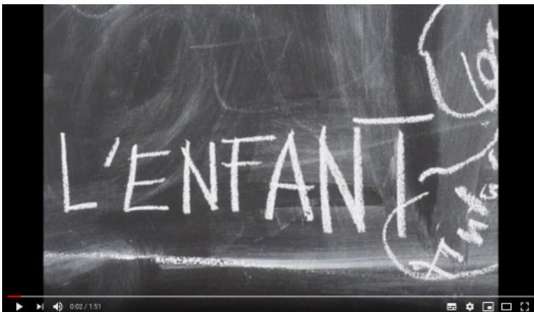
Présentation de l'Enfant par Elise Vigneron - https://www.youtube.com/watch?v=HgC5NeNmv3E