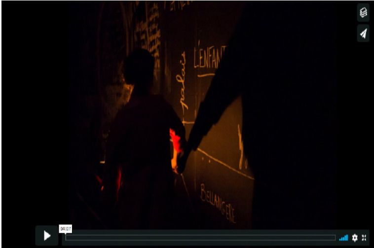
Teaser L'Enfant - https://vimeo.com/321432397