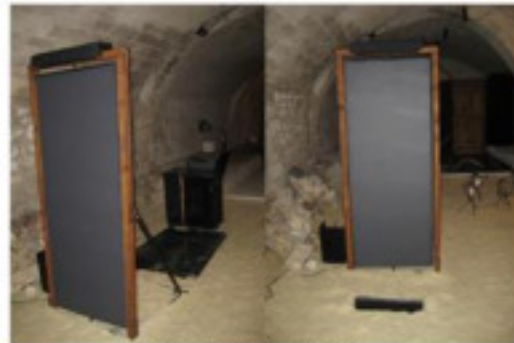
Porte 2 - Zone 2