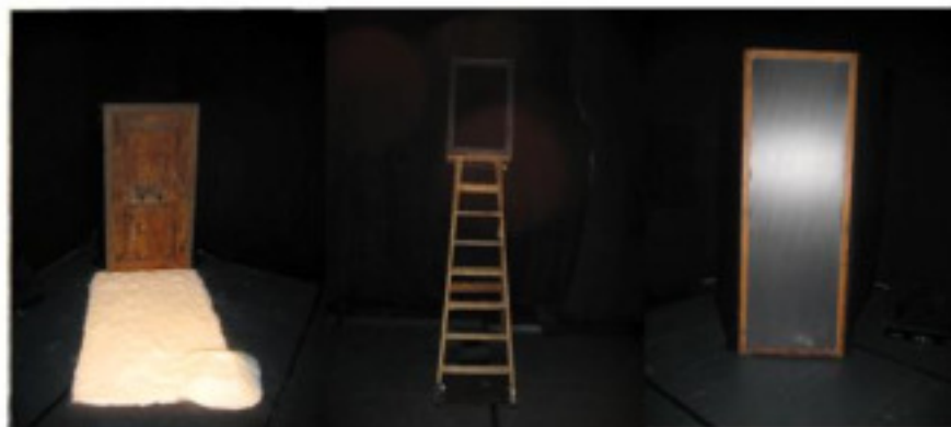
Porte 5 - Zone 5