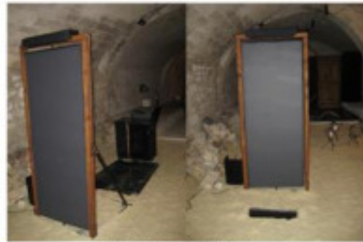
Porte 2 - Zone 2