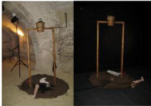
Porte 1 - Zone 1