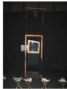
Porte 4 - Zone 4