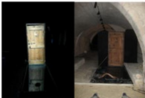
Porte 3 - Zone 3