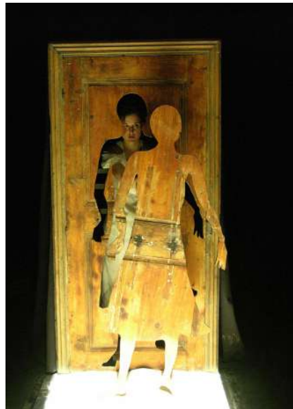
Aus dem Rahmen gefallen: Auf dem Parcours „Traversées“