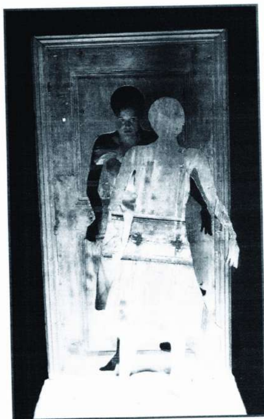
Teatre de l'Entrouvert

Chegamos á 22 edición da Feira de Teatro de Títeres de Lleida celebrada nos días 28, 29 de abril e primeiro de maio baixo unha ameaza de choiva que non logrou transcender na marcha da programación. Outro feito ameazante, este si executado, foi o recorte do orzamento orixinal que obrigou reorganizar a programación, reducir número de compañías e minguar o número de días do evento, mais non repercutiu na calidade con espectáculos que se exhibiron nun amplo número de espazos convencionais como poden ser as salas do Teatro Escorxador ou do Centro de Títeres, espazos alternativos como a Sala municipal de exposicións da Plaça de Sant Joan ou o Pati IEI e mesmo na rúa cuxo centro neuráxico é a Praza de Catedral.