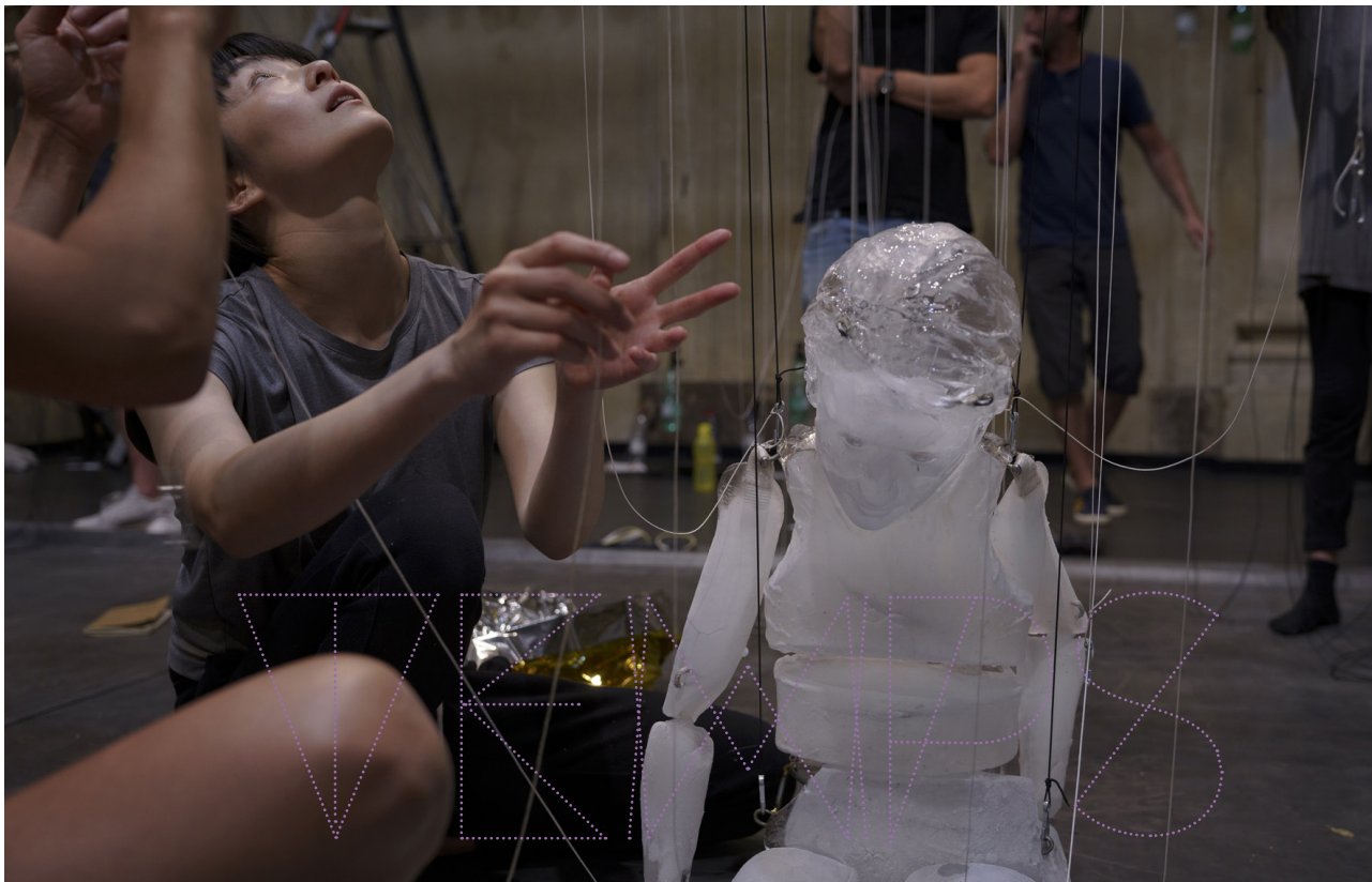
© Juliette Guidoni - Travail en cours : Résidence au Théâtre des Bernardines, Marseille (13) - juin 2022