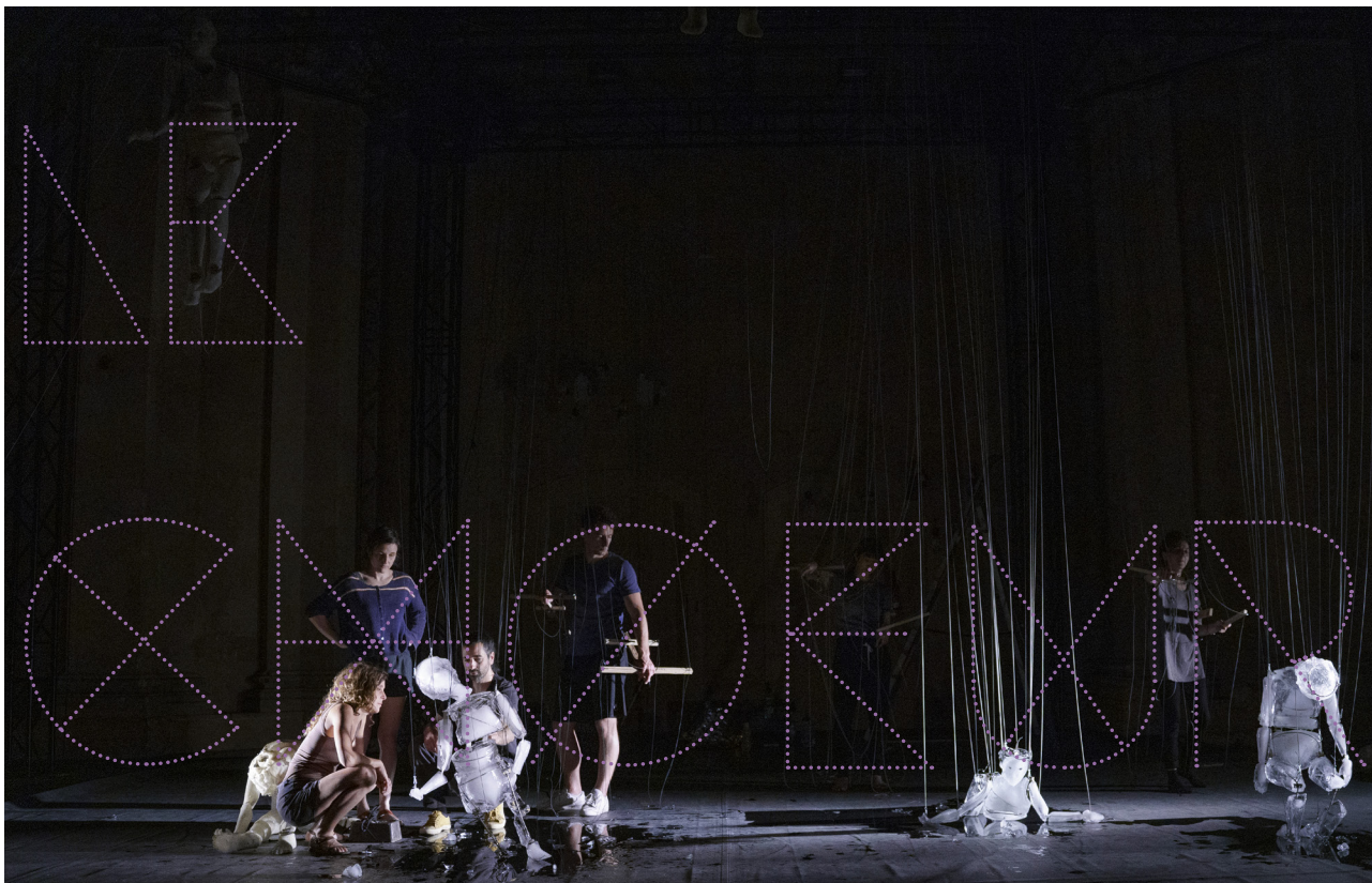
© Juliette Guidoni - Travail en cours : Résidence au Théâtre des Bernardines, Marseille (13) - juin 2022