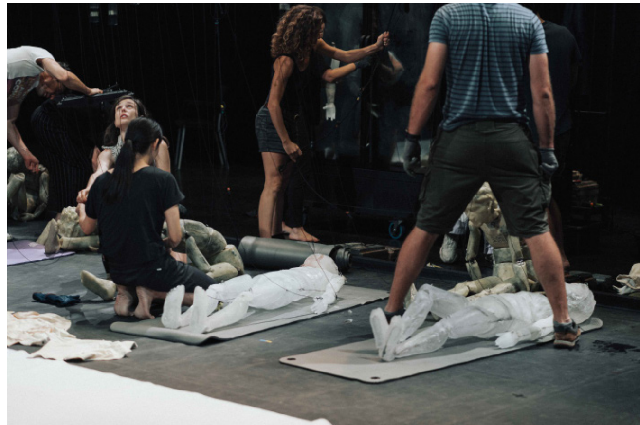
répétition, filage, octobre 2023

Au sol, couvrant l'ensemble de l'espace scénique, un bac de 7m sur 9m réceptionne l'eau de la fonte. Des vagues prennent place au fur et à mesure de la transformation de ces personnages en eau. Tout un vocabulaire plastique et gestuel se développe autour de la présence de l'eau.