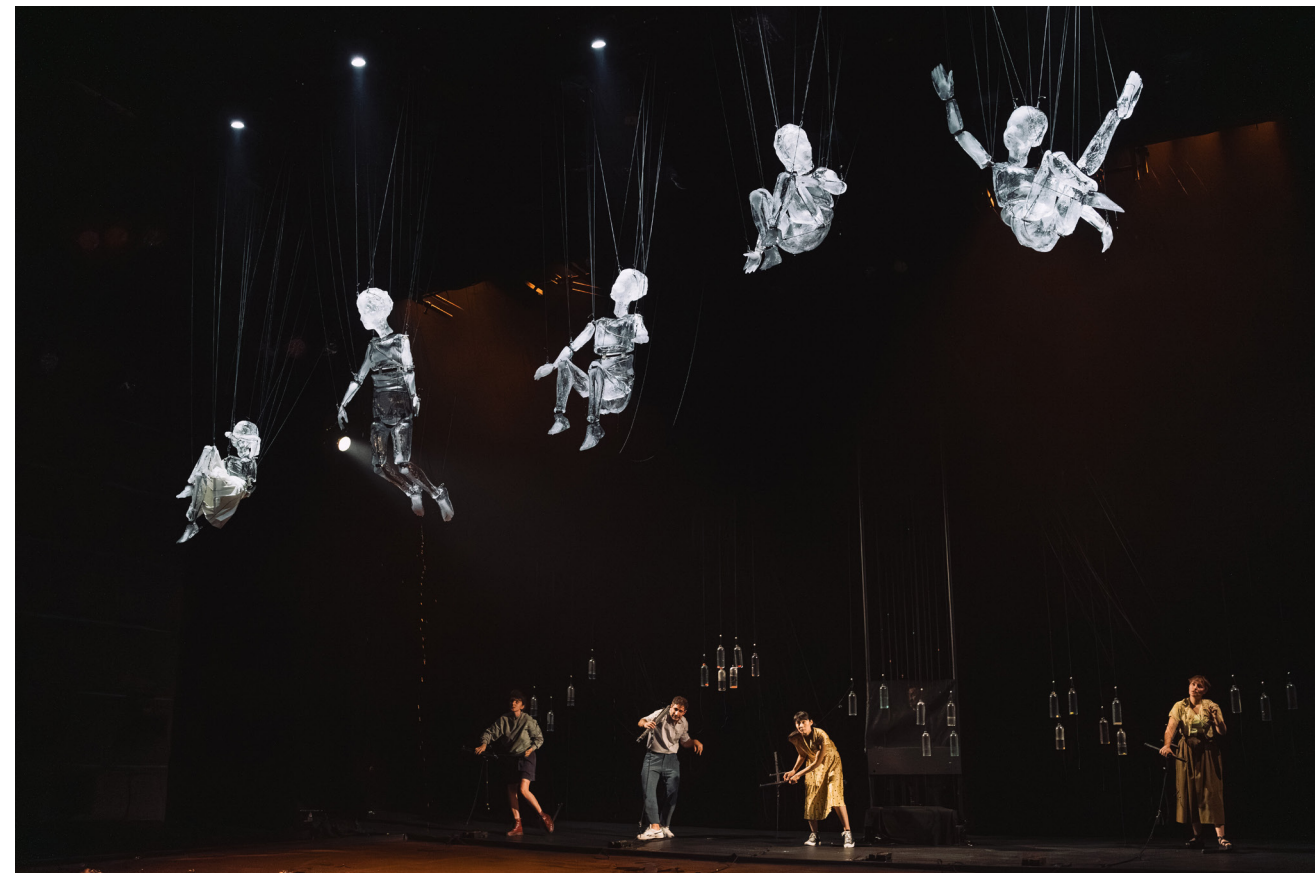
Série de premières au Théâtre Joliette, octobre 2023

À l'image de ces jeux de renversements, les différents types de relations possibles entre marionnettistes et marionnettes rendent tangible cette sensation d'interférence, de réciprocité et de glissement d'une identité à une autre. Porosité, elle-même présente entre les personnages entre eux.