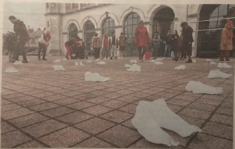
Les spectateurs ont pu visionner l'installation de près, avant qu'elle ne disparaisse en fondant.

Chaque participant, doté d'une glacière, se déplace sur le parvis de la halle aux grains pour former une chorégraphie avec ses partenaires. « Il s'agit de construire une œuvre qui part des mouvements universels du cosmos, jusqu'aux spécificités de l'humain », explique Élise Vigneron. « C'est pour cela qu'il est important d'avoir des personnes différentes, et de tous les