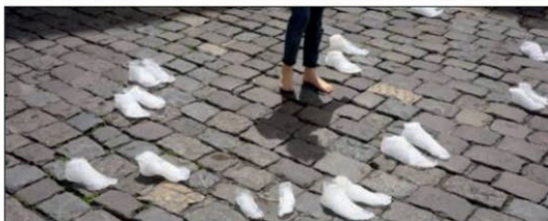
Dans son spectacle, Élise Vigneron met en scène des pieds moulés en glace.

Pour cette création, Élise Vigneron a fait appel à une quarantaine de participants dont elle a réalisé les moulages des pieds en glace. « Plusieurs ateliers ont eu lieu depuis pratiquement deux saisons, ici, avec des Gapençais. On a réuni des volontaires qui se sont fait mouler