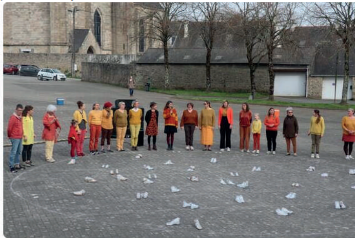
À la fin du spectacle, participants et metteuses en scène ont été largement applaudis par les près de 150 personnes présentes sur le parvis d'Athéna à Auray (Morbihan).