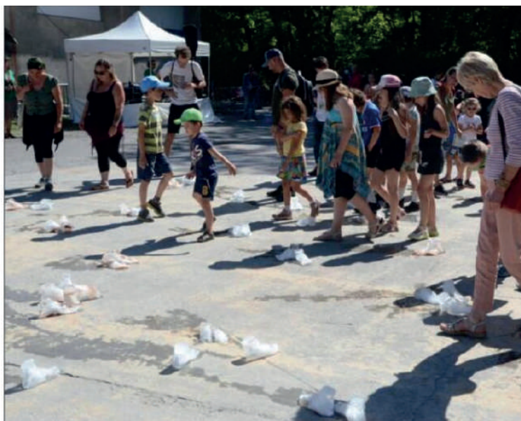
Lands, habiter le monde a nécessité la tenue de plusieurs ateliers pour mouler les pieds des habitants.