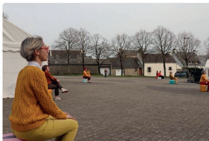
Au début de Lands, performance participative jouée dans le cadre du festival Méliscènes à Auray (Morbihan), chacun des 18 performeurs amateurs était assis sur la glacière qui abritait ses moulages de pieds en glace.

Leur pas est sûr. Un à un, les dix-huit performeurs amateurs de Lands traversent l'espace, s'arrêtent et s'assoient sur leur glacière. Une musique, des basses lourdes commencent à vrombir, Puis les habitants, comédiens d'un jour, se mettent en mouvement. D'abord solitaires, ils se rassemblent, se synchronisent, ne font plus qu'un, dans un mouvement circulaire continu où chaque corps teste son équilibre, sa gravité. Des voix, des bribes se font maintenant entendre très nettement, enveloppe le public massé sur les marches du parvis d'Athéna, à Auray (Morbihan) , ce samedi 19 mars 2022.