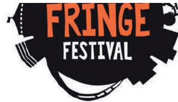
2025 ESL Rochester Fringe Festival Logo