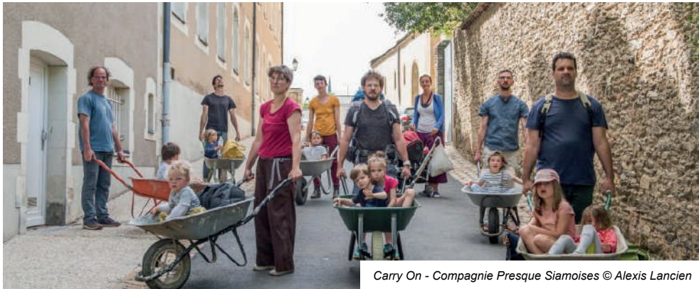
Carry On - Compagnie Presque Siamoises © Alexis Lancien