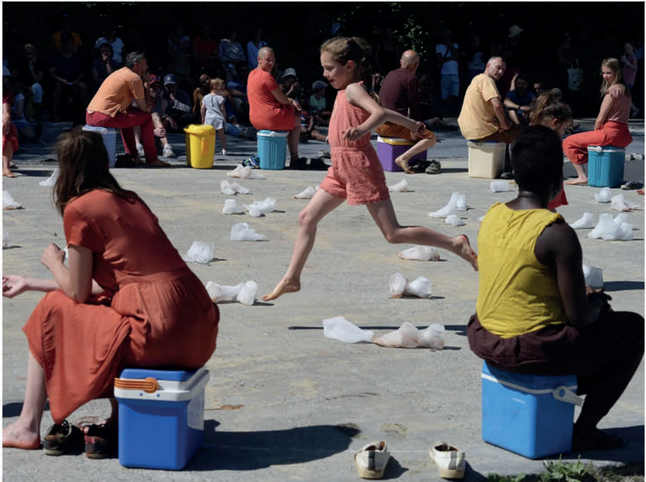
An earlier performance of "Traces"

The participants - in essence the cast - will be part of a choreographed program within the Spiegelgarten (they've spent the week rehearsing). The feet, placed throughout, gradually melt away with the revelations appearing inside.