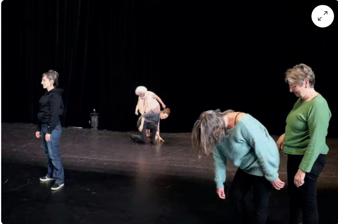
Les exercices demandés par les metteuses en scène ont régulièrement provoqué des scènes de franche rigolade.