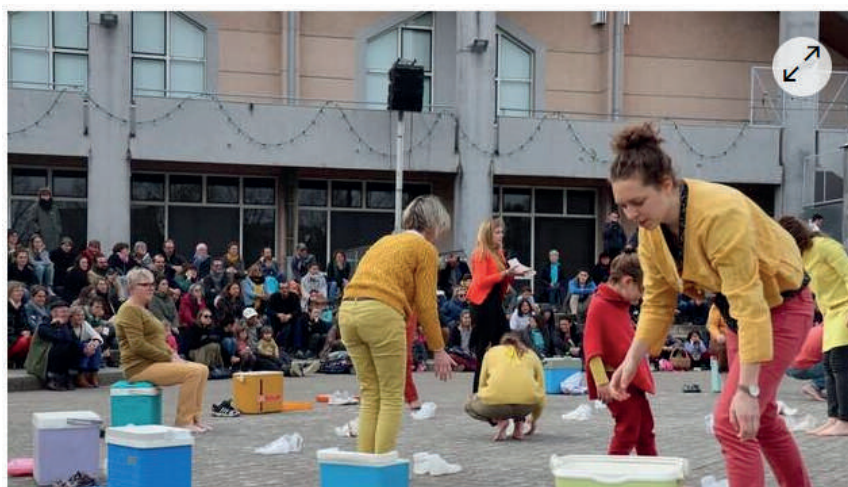
Pour Lands, chacun des participants, habitants du territoire d'Auray (Morbihan), avait moulé ses pieds en glace.

Lands, performance artistique collaborative créée par Le Théâtre de l'Entrouvert avec une vingtaine d'habitants d'Auray (Morbihan), a attiré près de 150 personnes sur le parvis d'Athéna à Auray, ce samedi 19 mars 2022. Un spectacle, commencé il y a trois semaines, à la fin duquel les participants ont laissé leur pied de glace fondre sur les pavés.