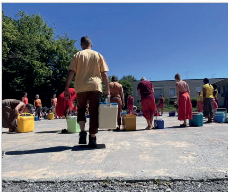
Lands, habiter le monde , a permis aux acteurs amateurs de nouer des liens qui perdureront après la dernière représentation.